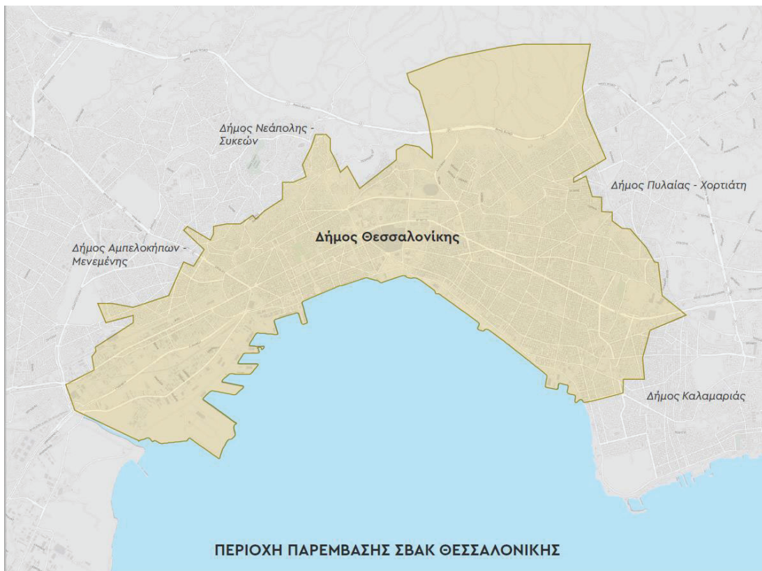
ΣΒΑΚ ΔΗΜΟΥ ΘΕΣΣΑΛΟΝΙΚΗΣ, ΟΡΙΑ ΠΕΡΙΟΧΗΣ ΠΑΡΕΜΒΑΣΗΣ