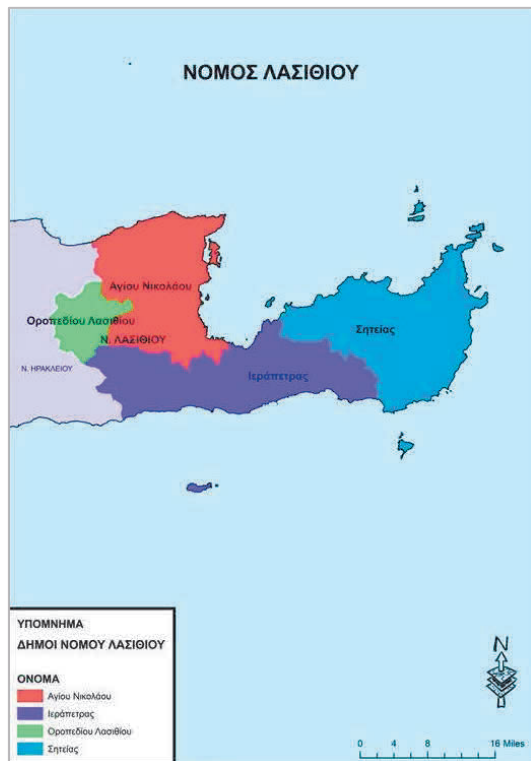
Χάρτης: Περιοχή Παρέμβασης του Σ.Β.Α.Κ. Δήμου Σητείας